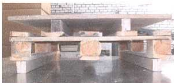
Zginanie na szerokości palety