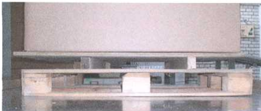
Zginanie płyty górnej