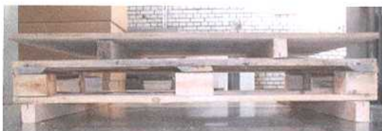
Zginanie na długości palety